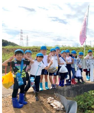
園外保育（お芋掘り）