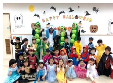
ハロウィン仮装行列